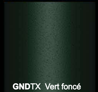
GNDTX Vert foncé